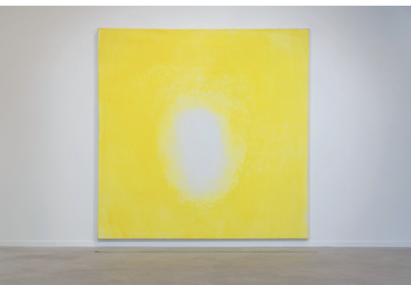
Olivier Debré, sans titre , c.1988, huile sur toile, 280 x 280, Collection particulière, photo ville d'Amboise.

Exposition en partenariat avec l'Atelier Calder à Saché (37), où Rosa Barba a été accueillie en résidence de mi-septembre à mi-décembre 2021. Commissariat : Elodie Stroecken